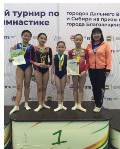
ӨСВӨРИЙН ШИГШЭЭ БАГ