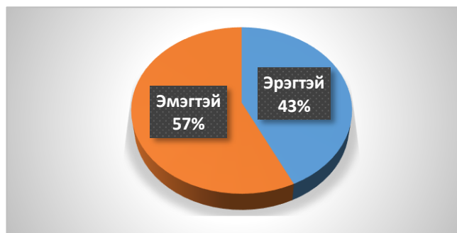
Зураг 1. Жендэрийн харьцаа